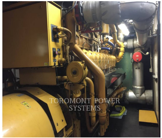
TOROMONT POWER SYSTEMS